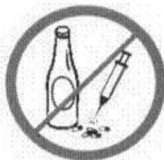
Napoje alkoholowe, narkotyki