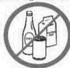
Butelki, puszki, kulki, dzbanki