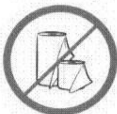
Duże ilości papieru