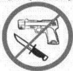
Broń, materiały wybuchowe, noże