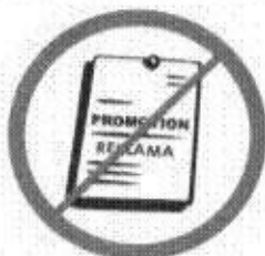
Przedmioty, materiały, ubrania komercyjne i promocyjne