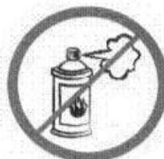
Gaz w aerozolu, substancje żrące, łatwopalne, barwniki