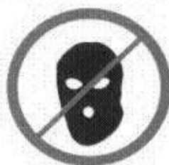
Części ubioru zakrywające twarz, kominiki