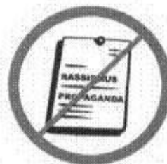
Materiały rasistowskie, ksenofobiczne, polityczne, religijne, propagandowe