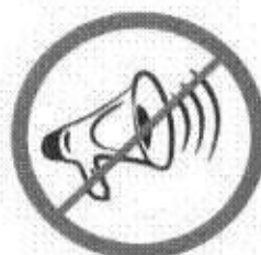
Megafony, syreny, inne urządzenia emitujące dźwięk