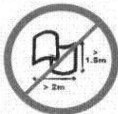
Banery lub flagi o wymiarach większych niż 2,0 m x 1,5 m