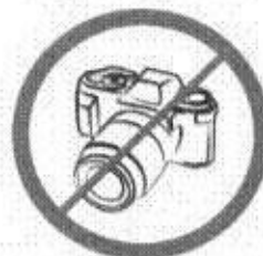
Profesjonalne aparaty fotograficzne, kamery wideo