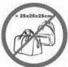
Pułki, torby, plecaki, walizki i inne wszelkie przedmioty większe niż 25 cm x 25 cm x 25 cm